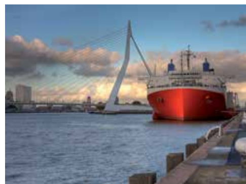
Ein Meilenstein in der Geschäftsgeschichte: Belieferung eines kompletten Schiffs in Kroatien

rat bei Bedarf des Kunden schnell, gezielt und einfach aufzustocken“, erklärt er die Konzeptidee. So simpel sie klingt, so effektiv ist sie zugleich. Die Webseite zeigt eine Übersicht über die Produkte, „die ständig gebraucht werden“, erklärt Verbakel. Wo bei anderen Anbietern der Vorrat streikt, hilft Verbakel Stainless Steel mit seinen Lagerbeständen aus. Der Kunde sieht auf der Webseite, ob seine benötigte Artikelanzahl, egal ob Einzel- oder Paketware, verfügbar ist.