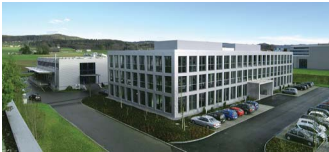
Freundliche Übernahme: Die BIBUS Gruppe (im Bild der Konzernhauptszitz im schweizerischen Fehraltorf) besitzt nun die Mehrheit an der S+D Spezialstahl GmbH.

Und noch eine Eigenschaft verbindet die BIBUS Gruppe mit der S+D Spezialstahl GmbH: Bei allem Selbstbewusstsein gibt es einen durchaus sympathischen Hang zur Bescheidenheit. „Wir sprechen von uns, wollen aber nicht großspurig auftreten“, stellt Schenk klar, während Bibus zustimmend nickt. Dass es sich dabei nicht nur um leere Worte handelt, sondern in der Chefetage tatsächlich Understatement gelebt wird, zeigt sich spätestens beim Mittagessen: Anstatt die Unternehmenshochzeit pompös in einem Restaurant zu begießen, bescheiden sich die Firmenlenker mit belegten Brötchen im Konferenzraum – und sind dennoch bester Dinge. Froh zu sein bedarf es eben wenig.