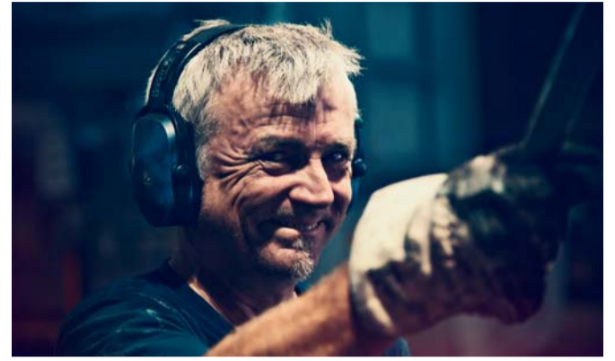
Viele 25- und 40-jährige Firmenjubiläen zeigen, dass die Zufriedenheit groß und die Mitarbeiterfluktuation gering ist.