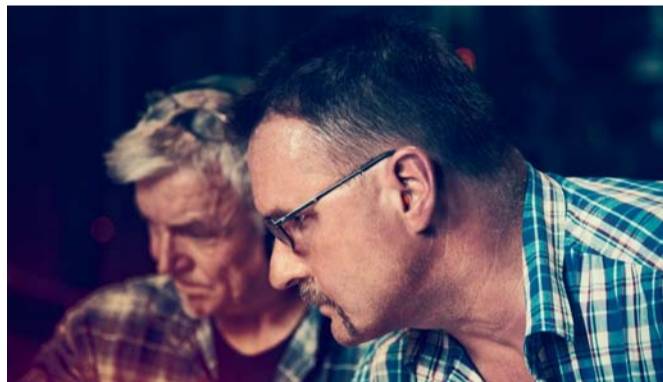
Für die Einzelfertigungen auf höchstem Niveau bedarf es eines reichhaltigen Erfahrungsschatzes, den die Mitarbeiter an ihre Kollegen weitergeben.

Qualitätsstandards eingehalten werden. Um das zu gewährleisten, sind die zerstörungsfreien Prüfmöglichkeiten allesamt nach DIN EN ISO 9712 und – bis auf die Sichtprüfung – nach SNT-TC-1A zertifiziert. Werksinterne Werkstoffabnahmemöglichkeiten nach EN10204 2.2 und EN10204 3.1 vervollständigen das Angebotsspektrum. „Auch die Abnahme nach EN10204 3.2 können wir durchführen, und zwar mit namhaften Abnahmegesellschaften wie etwa dem TÜV, Swiss TS SVTI, Bureau Veritas, Lloyds Register of Shipping, um hier nur einige zu nennen“, erklärt Kramer. Letztlich garantiert die hundertprozentige Endkontrolle jedes Produkts auf Material, Werkstoffbeschaffenheit und Abmessung nicht nur höchste Qualität. Sie erspart dem Kunden auch Kosten, sind sich Höver und Kramer einig. So werde die Zerspanung nämlich bedeutend einfacher und für den Kunden preiswerter.