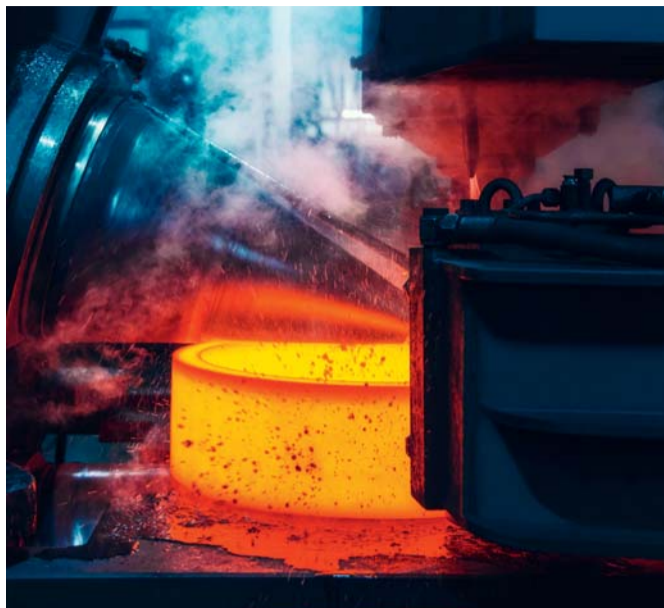
Rotierende Walzen formen das Material um.