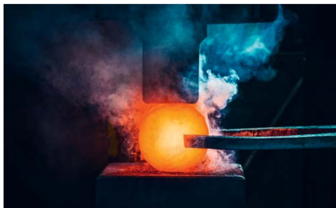
Präzisionsarbeit: Ein Ringrohling wird geschmiedet.

nahtlos gewalzte Ringe von klein bis groß produziert. „Ringe machen rund 75 Prozent unserer Fertigung aus“, weiß Kramer. Zudem umfasst das reichhaltige Lieferprogramm viele weitere Produkte, wie zum Beispiel Scheiben, Lochscheiben, Büchsen, Stabstahl in rund, flach, vierkant, sechskant, abgesetzte Wellen, Sonderflansche und sonstige Schmiedestücke, die das Werk jeden Tag verlassen. Das umfangreiche Qualitätsspektrum des Unternehmens